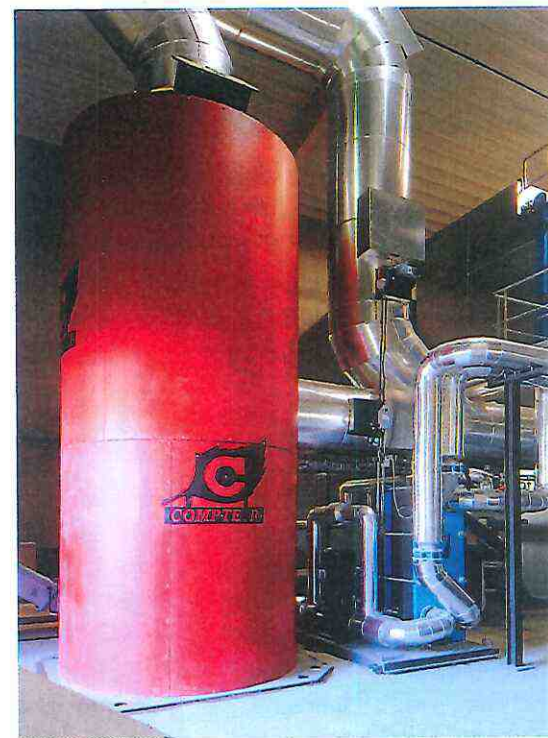
Condenseur CESYS

Comme pour les installations neuves, COMPT'Acte Services propose d'évaluer la pertinence d'un équipement additionnel de récupération d'énergie sur une installation existante. Trois niveaux de récupération sur les