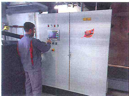
Technicien à l'oeuvre sur une armoire électrique

Comme pour les installations neuves, COMPT'Acte Services propose de mettre à niveau les installations existantes en matière d'émissions atmosphériques. L'entreprise propose ainsi d'ajouter ou de remplacer des équipements par un système électrostatique ou à manches selon le résultat attendu.