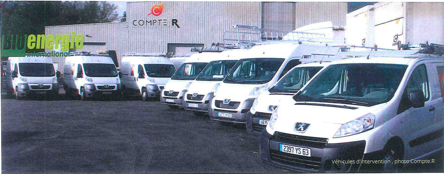
Véhicules d'intervention