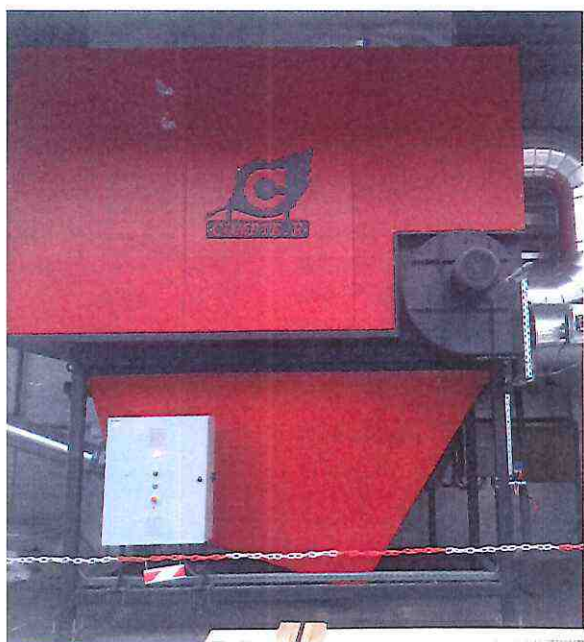
Filter à manches