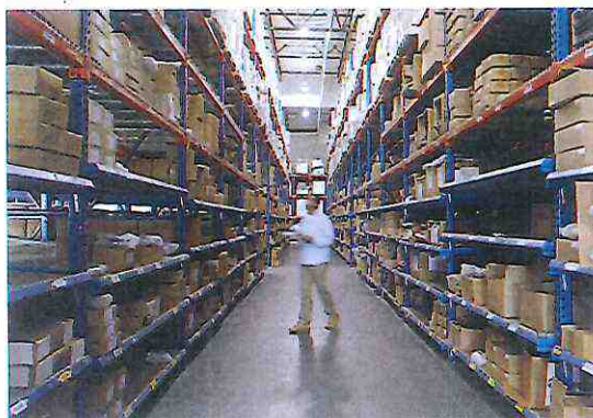
Stock de pièces

3500 références en stock sont livrables dans un délai de 24h à 48h.